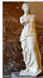
retrouvée dans l'île grecque de Milos