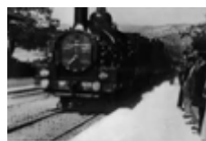
Arrivée en gare de la Ciotat

film majeur de l'histoire du cinématographe, tourné par l'industriel lyonnais Louis Lumière durant l'été 1895