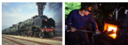
Locomotive à vapeur et un conducteur